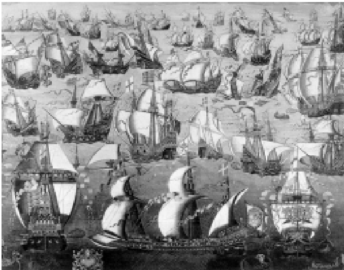
A Armada de Filipe II.

A empresa militar foi cuidadosamente preparada. Uma poderosa frota de 130 navios partiu rumo à Inglaterra em 1588 . Uma tempestade ajudou a destruir grande parte da Armada Invencível espanhola. No final da expedição, apenas metade das embarcações retornou aos portos espanhóis. A derrota da armada marcou o início da decadência espanhola e o começo da expansão marítima inglesa .