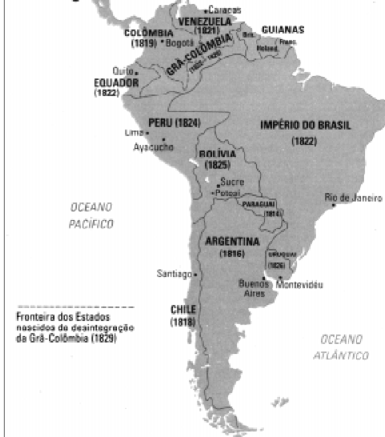
A independência das colônias da Espanha e de Portugal na América do Sul