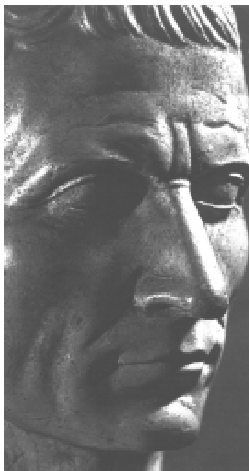
Detalhe de estátua de Júlio César.

Depois de derrotar os últimos aliados de Pompeu, César foi proclamado o pai da pátria e pôde, então, realizar várias reformas.